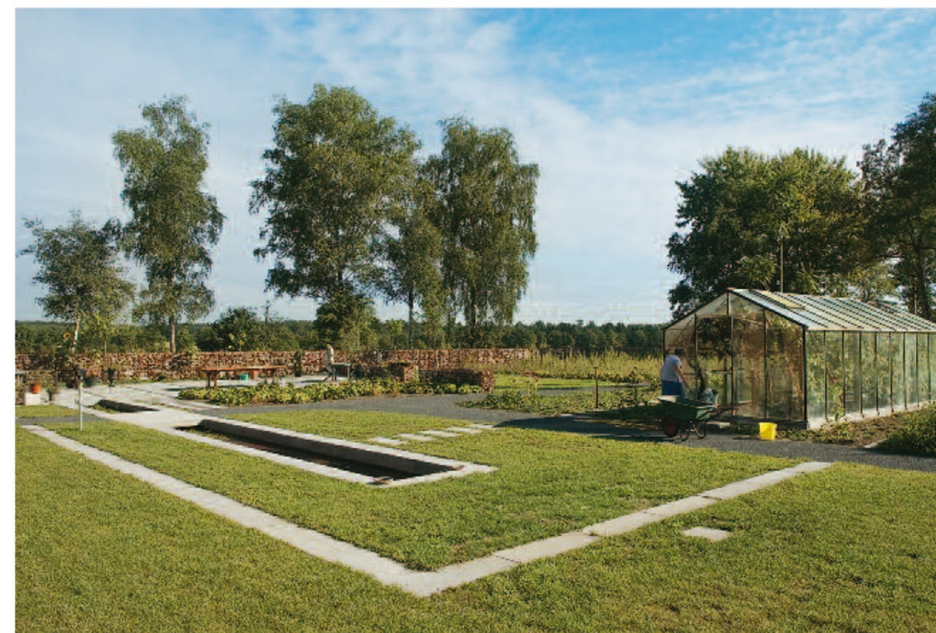
De watertuin ligt open en bloot aan de rand van het park.

staat voor zuiverheid en bron van leven. Het nest jonge kwikstaartjes in de oude pomp van de modelboerderij vormt de concrete, aardse vorm van deze symboliek. In een tweede vak zijn laagvertakte appelbomen geplant, die wat schaduw bieden en het zicht filteren. De rolstoelbestendige paden zijn van rode halverharding en binnen de grijze betonranden van de overige vakken bestaat de beplanting uit bodembedekkers met enkele solitaire planten en bollen. De planten zijn niet alleen gekozen om hun kleurschema van grijsgroen en roze, maar ook om hun Bijbelse symboliek. Hier geen banken, de ruimte blijft leeg. Dit is een plek om in