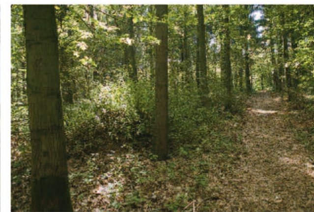
Het bos behoort tot het binnenslot en is niet toegankelijk voor bezoekers en buienstaanders.