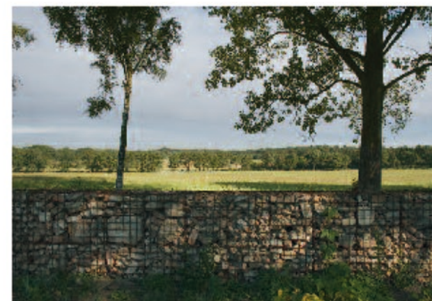
De slotmuur van schanskorven met puin van het oude gebouw.