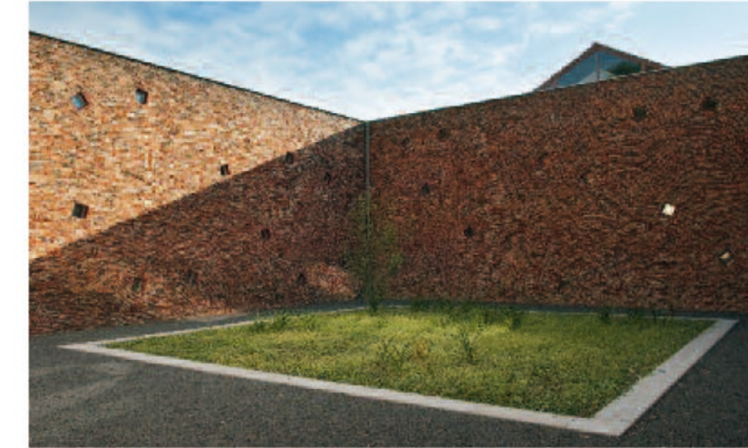
De stille hof voor gasten die in retraite gaan.