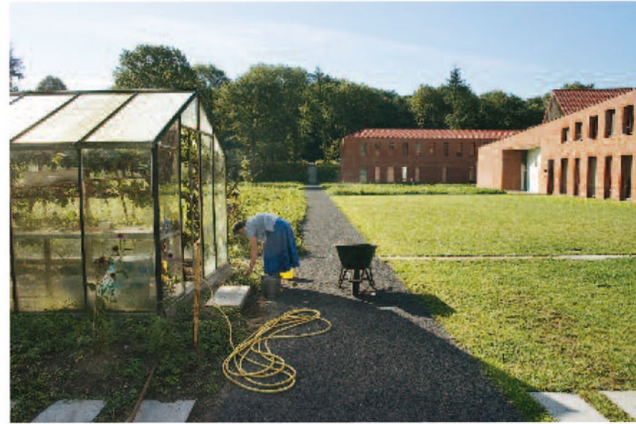
De moestuin aan de rand van het park.