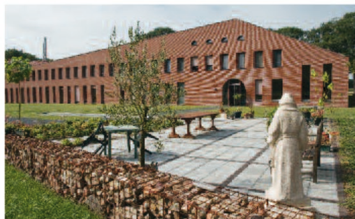
Stroken bakstenen tussen het grijze beton en planten in potten: een niet erg geslaagde poging om het terras intiemmer te maken.