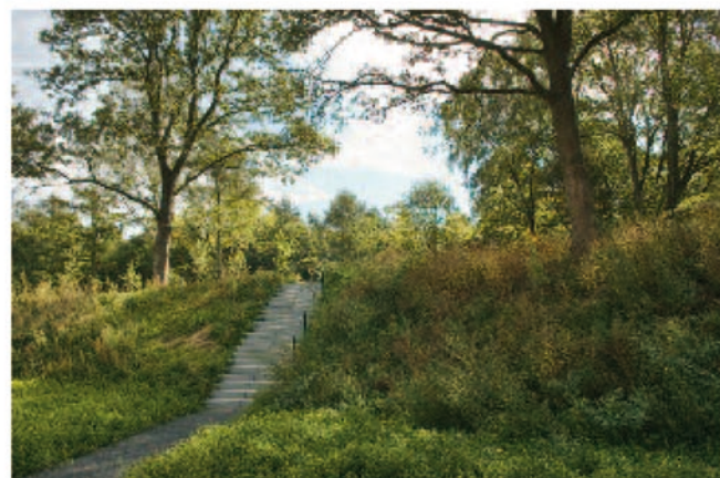
Hoogteverschillen zijn overbrugd door grote vlakken te verbinden door taluds en korte knikken.