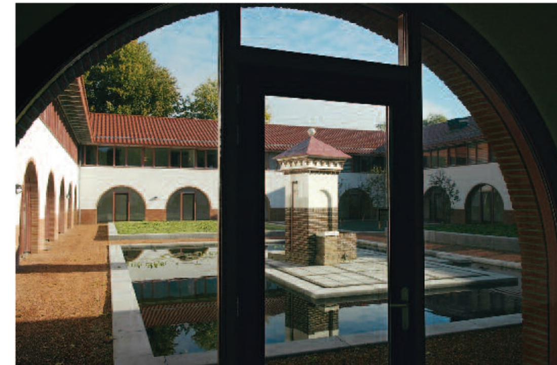
De pomp in de vijver herinnert aan de Johannahoeve die hier begin vorige eeuw werd gebouwd.

Wie de bewoonde wereld van Oosterbeek achter zich laat, treft na een korte wandeling door het bos aan het einde van een lange laan een aantal gebouwen rond een klein voorplein. Het is de abdij Koningsoord, die dit voorjaar werd betrokken door ruim dertig zusters van de Cisterciënzer Orde uit Berkel Enschoot.