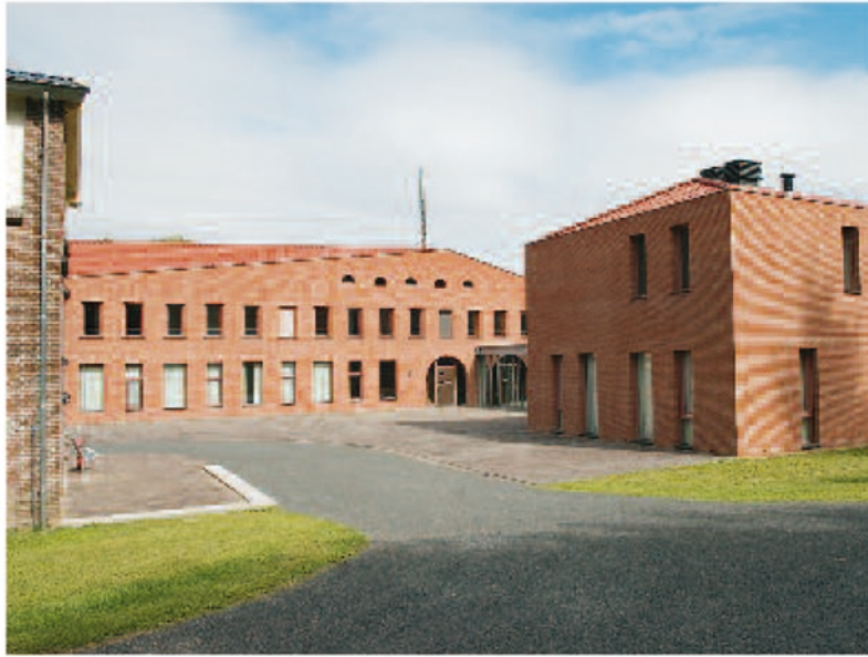
Het voorplein bij de ingang van de abdij.