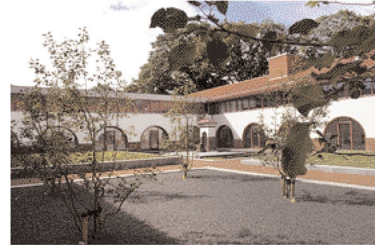
De hof in het binnenslot is door de witte muren en de rode halfverharding lichter en vriendelijker dan de andere hof.