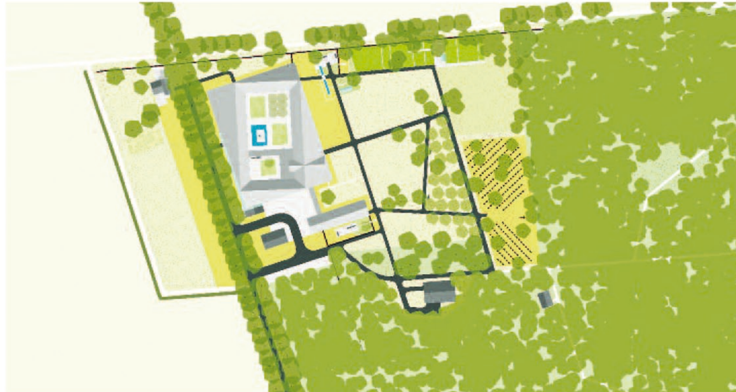
Plankaart. De hoven liggen 15 graden gedraaid ten opzichte van de contour van het gebouw.