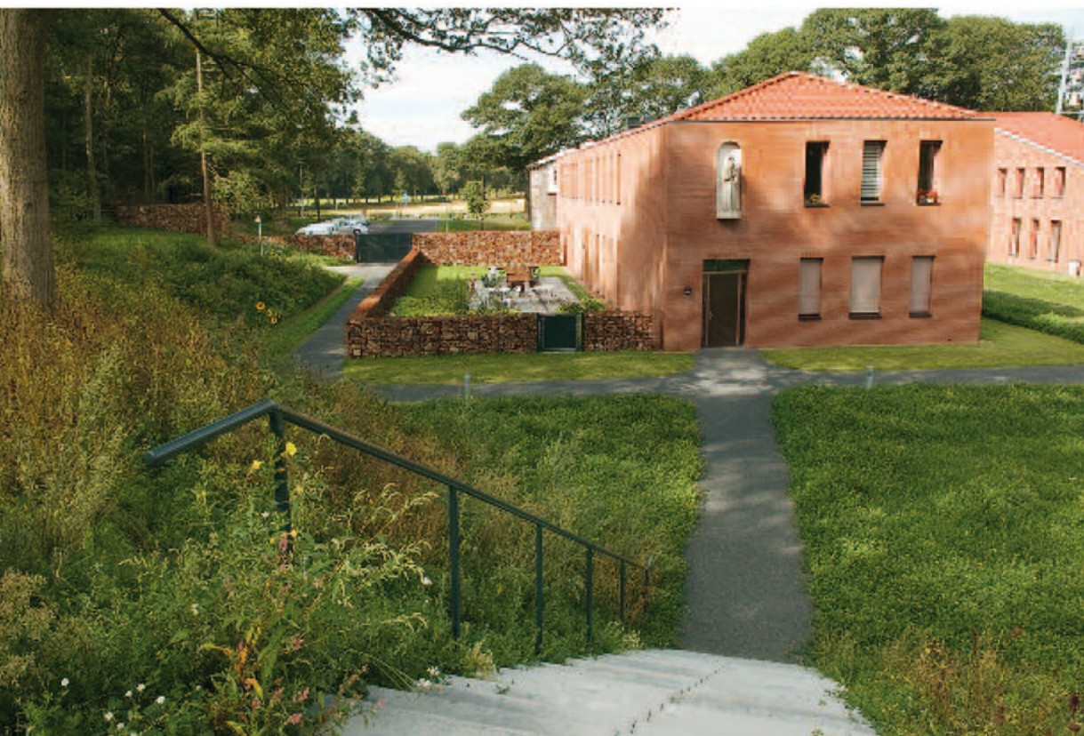
De slotmuur (linksachter) vormt de begrenzing tussen privé en openbaar. De omsloten tuin is bestemd voor de gasten en hoort bij het buitenslot.