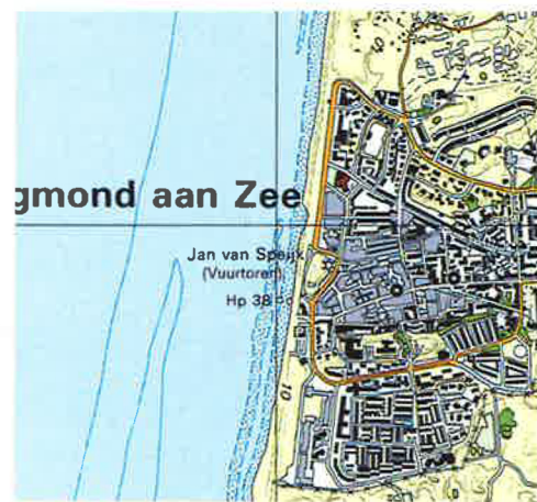
Onderwerp: herinrichting kuststrook Locatie: Egmond aan Zee

De kuststrook is aangepakt volgens het motto: geen nieuws, goed nieuws. Egmond koos voor een stijl en een ambitieniveau die geheel in overstemming zijn met de mode in de openbare ruimte. Sober, leeg, goed georganiseerd, mooie materialen. Maar in Egmond is dat maar een kant van het verhaal. Wie de moeite neemt om eens van de zee weg te kijken en de bebouwing langs de boulevard in ogenschouw neemt, ziet een aaneenschakeling van armoedige bouwsels. Wellicht is de blik op zee zo voor de hand liggend dat niemand het nodig vindt voor de overkant een zeker niveau te eisen. Daar is