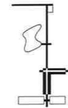
Wegen, paden en pleinen Roads, paths and squares