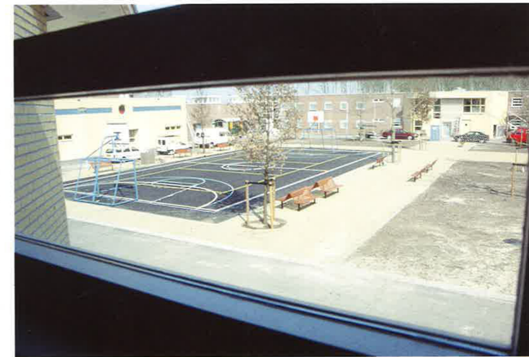
De tuin met de vijver. De binnenplaats gezien vanuit het nieuwe cellenblok. Pond garden. The courtyard seen from the new cell block.