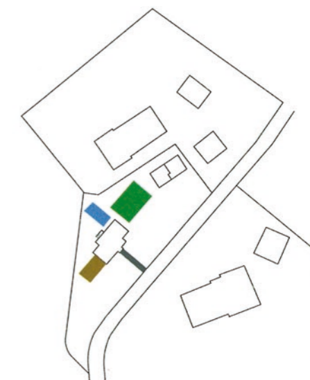
De enclave van twee boerderijen en de moderne woning.

De eigenaren hadden wat de beplanting betreft geen voorkeuren. Sowieso was hun wensenlijst niet groot. Alleen het zwembad en een groot terras waren uitdrukkelijke wensen van de bewoners. „Het programma van eisen is eigenlijk in het gesprek ontstaan. Voor het idee van het huis verlengen naar de verschillende kanten toe waren ze meteen gewonnen.” Dit gaf de tuin- en landschapsarchitect de vrijheid om een strakke tuin te ontwerpen waarvan de wanden door het landschap worden gevormd. ■