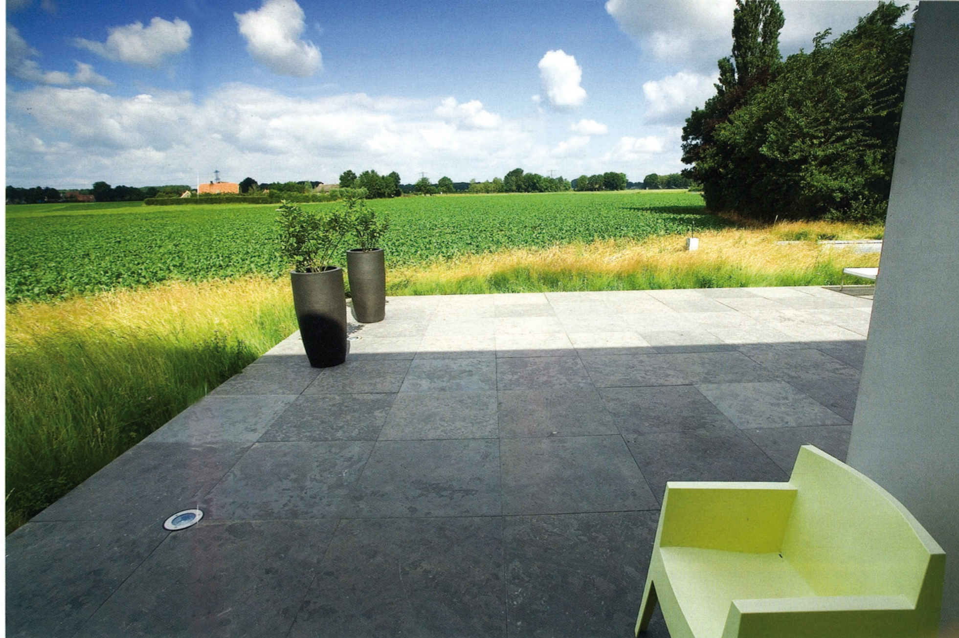
Het grote terras van Chinees graniet met uitzicht op de akker. Doordat de begrenzing tussen tuin en akkerland ontbreekt, lijkt het perceel oneindig groot. Waar stopt de tuin en waar begint het landschap?

Tekst Wendy Bakker